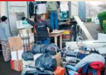
Equipe, die den Container beladen hat