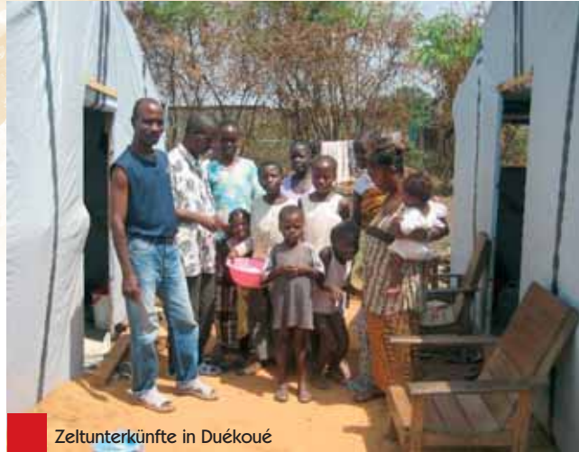
Zeltunterkünfte in Duékoué

Seit November 2011 hat sich die volkswirtschaftliche und auch die politische Situation etwas beruhigt. Das erlaubt es uns, unsere Tätigkeiten bei den betroffenen Menschen mit mehr Gelassenheit und Ruhe anzugehen. Allerdings leben noch viele dieser Menschen in der Angst, denn noch immer gibt es in einigen Gebieten des Landes Probleme mit der Sicherheit. Andere befürchten ein Wiederaufflackern der Gewalttätigkeiten und können sich nur schwer entschließen für eine definitive Rückkehr nach Hause. Unsere