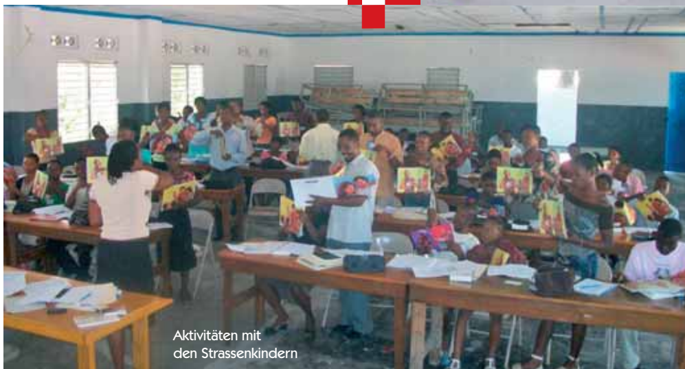
Aktivitäten mit den Strassenkindern

mer vor sich ginge, doch zeigen die Berichte der Leiter, dass sich das Programm gut entwickelt. Die Kindertreffs finden an ein bis zwei Nachmittagen pro Woche statt und dauern von 15 bis 18 Uhr. Über 750 Bibeln und Neue Testamente konnten schon an die Kinder verteilt werden. Die Leiter bekommen auch Lehrmittel und Bücher mit biblischen Geschichten zum Weitergeben. Die Kinder erhalten ebenfalls Süßigkeiten.