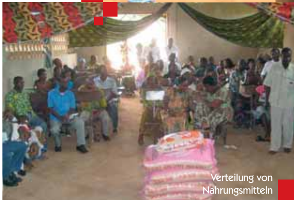
Verteilung von Nahrungsmitteln

versprochen, für Wasser zu sorgen und Latrinen zu errichten, damit die Last für die Kirche verkleinert wird. Dank dieses Vorschlags konnten Probleme, die sich abzeichneten, im Keim erstickt werden. So haben auch jene Leute, die noch länger im Motel in Cocody bleiben wollten, akzeptiert, die Zimmer frei zu geben.